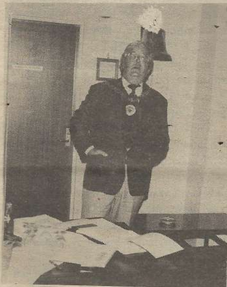
Gradonačelnik gosp.w.A.McKenzie iz Fremantla pozdravlja sve prisutne uzvanike na svečanom primanju u Town Hallu

Za nas je ovo izvanredna čast, osobito u ovim danima kada mi slavimo 150 godina obstanka naše države, Zapadne Australije, koja je prije 150 godina postala slobodna država u sklopu austral-ske federacije.